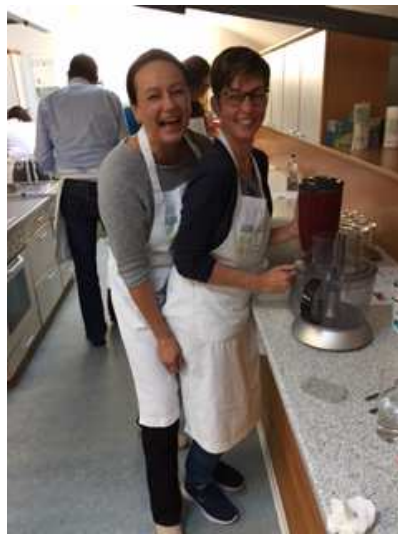
(Spass bei der Frühstücksvorbereitung)